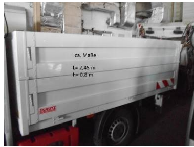
LKW mit 3,5 t

Maße: 410 x 100 cm (links) 300 x 100 cm (rechts)